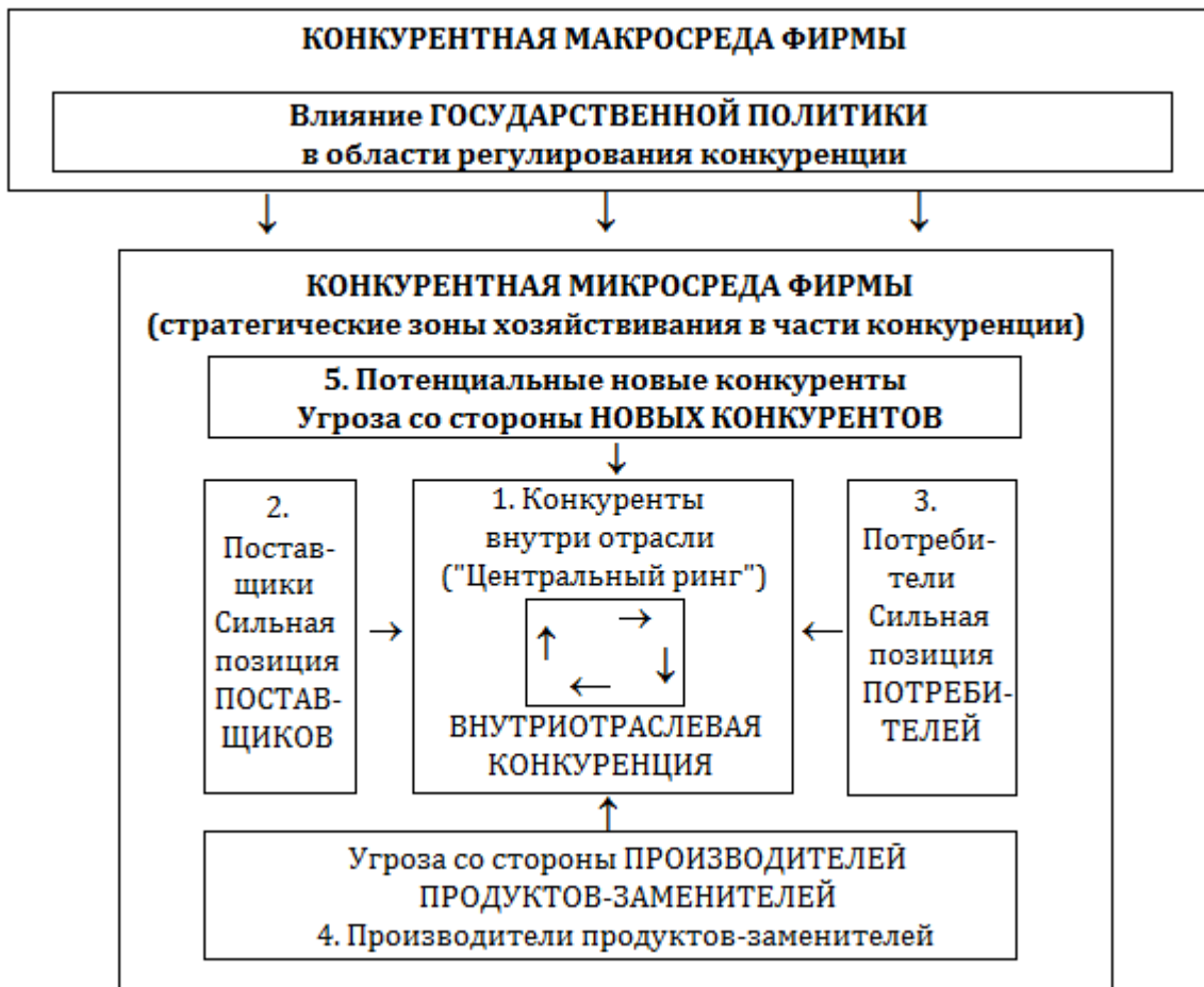
Рис. 4 Движущие силы конкуренции по Портеру [25]

3. Потребители (третья сила) – их инновационное влияние может выражаться в следующем: (1) Они выдвигают требования новых моделей, технологий и услуг. (2) В нежелании приобретать и платить прежние цены за устаревшую продукцию. (3) Потребители могут требовать нового режима поставки, например, обеспечения режима «канбан» - поставки точно в срок. (4) Они требуют нового уровня качества. [3.С.30]